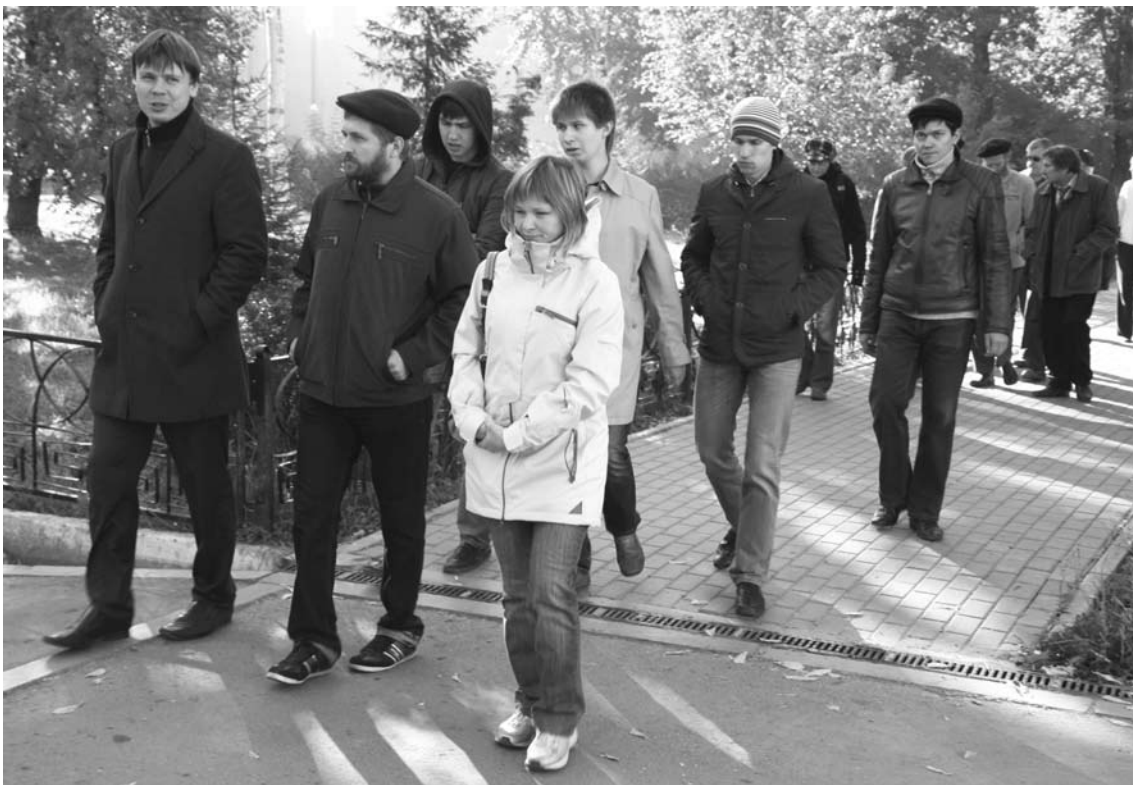
20 сентября в 10 часов молодые сотрудники Института математики и механики УрО РАН вышли на улицу около здания ИММ, поддержав всероссийскую флэш-моб акцию протеста против принятого Госдумой 18 сентября закона о реформе РАН