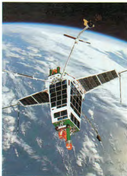
Искусственный спутник Земли «Компас - 2»

действенный ресурс обновления и развития страны, повышения конкурентоспособности отечественных разработок на рынке современных технологий.