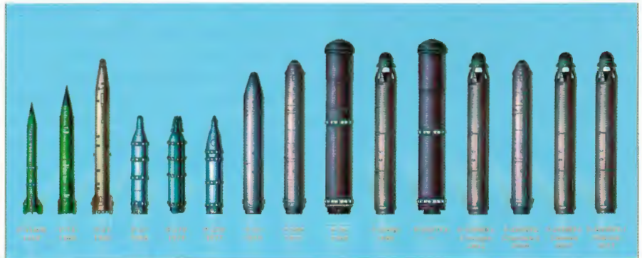
Баллистические ракеты подводных лодок разработки ОАО «ГРЦ Макеева»

На основе долговременного соглашения с Уральским отделением РАН, совместно с входящими в его состав